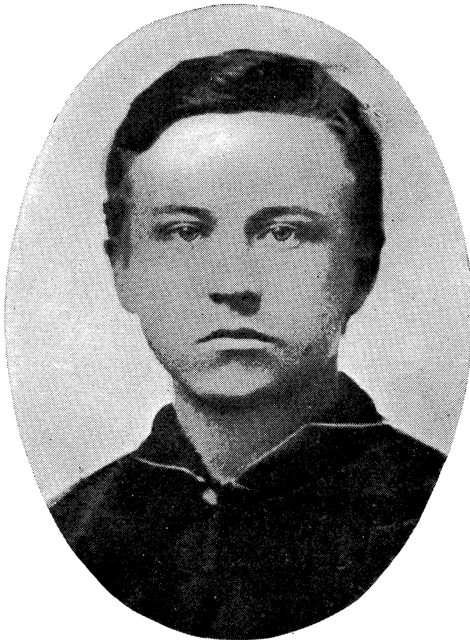
Henry Clinton Parkhurst de dieciocho años de edad, durante el sitio de Vicksburg (1862).